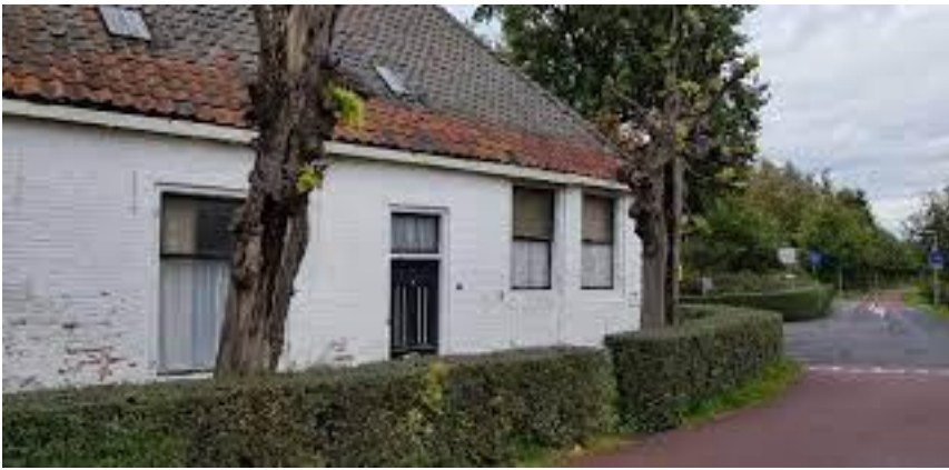
de herberg nu...