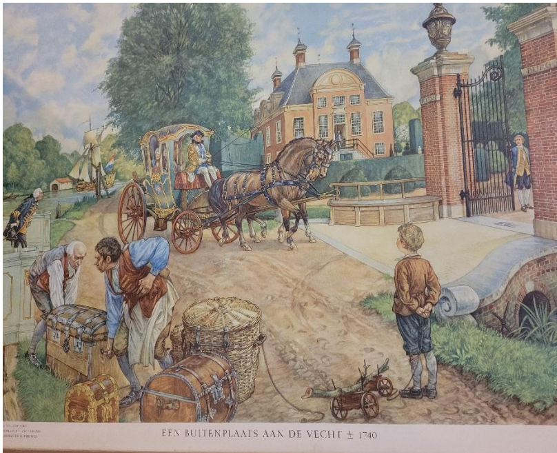
Schoolplaat, Vechtmuseum Maarsse

De familie van Tuyl van Serooskerken was nu aangekomen bij de oprijlaan van het slot, de benen konden gestrekt voor de laatste paar honderd meter naar het slot en de trekschuit kon nu uitgeladen worden.