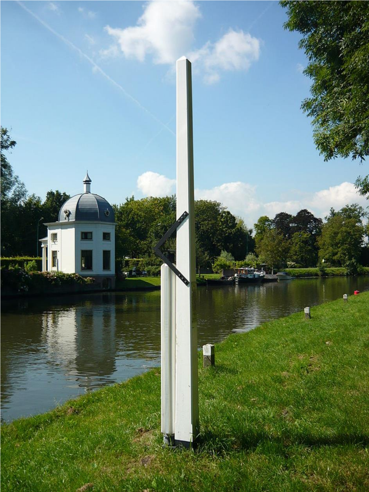
Replica van een jaagpaal elders langs de Vecht

voorkomend verschijnsel langs waterwegen, maar ze zijn bijna allemaal verdwenen. Tegenwoordig staat bij Daelwijck een replica.