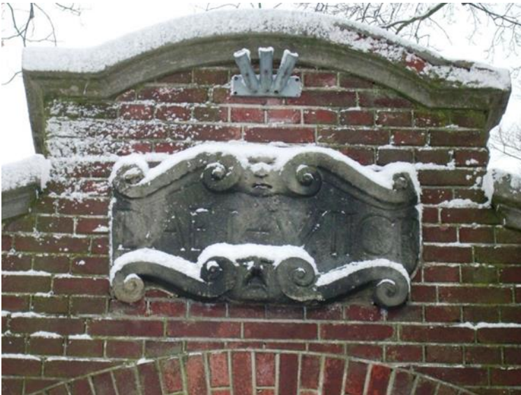
Naamsteen in de poort van Daelwijck aan de (huidige) burgemeester Norbruislaan

In de zestiende eeuw heetten de landerijen langs dit deel van de Vecht Sweserengh, een naam die heden ten dage wordt weerspiegeld in de Sweseringseweg, die loopt van Zuilen naar Maarsse. Er lagen meerdere buitenplaatsen, gebouwd door rijke stedelingen. Daarvan is uiteindelijk alleen huis Daelwijck overgebleven.